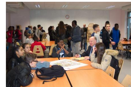
Collège Sophie Germain à Nantes

FACE Loire Atlantique permet aux collégiens de 3 ème et 4 ème scolarisés en Zone d'Education Prioritaire, de rencontrer des professionnels d'entreprise pour éviter une orientation par défaut et favoriser l'accès aux stages par la connaissance des métiers.