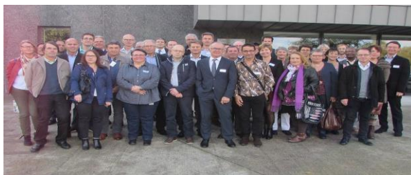
Senior Academy lancement en Nov. chez Total, St Herblain

315 professionnels présents lors des 10 petits déjeuners et rencontres thématiques.