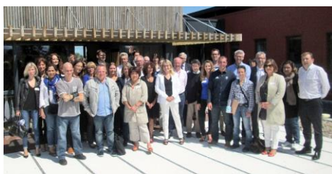
Job H' Academy lancée Chez Idea Groupe à Montoir de Bretagne à l'issue du club « Handicap & Emploi » en partenariat avec le Medef 44 et le Girpeh Pdl

Ces actions obtiennent des résultats intéressants de mise à l'emploi durable grâce à une forte mobilisation des professionnels d'entreprises : parrainage et coaching des candidats, proposition d'offres d'emploi, animations d'ateliers par des coachs experts dans leurs domaines.