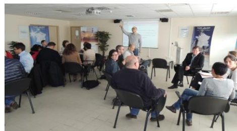
Petit déjeuner sur le fait religieux en entreprise

101 professionnels sensibilisés et formés à la diversité